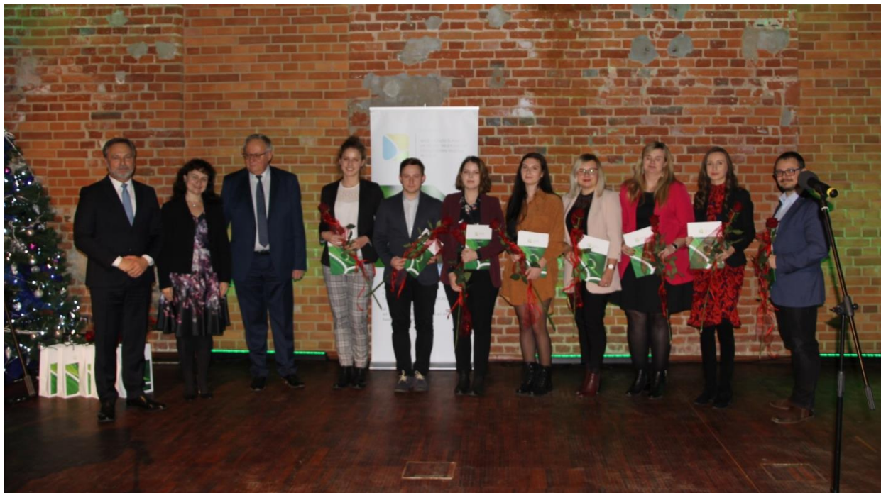
Fot. Nr 1 Laureaci VI edycji Konkursu „Ekologiczny magister i doktor”