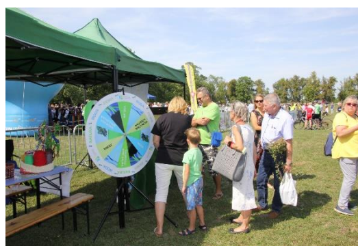
Fot. Nr 2 Dożynki Województwa Łódzkiego w Walewicach .

Ponadto, Fundusz prowadził także inne działania promocyjne poprzez: